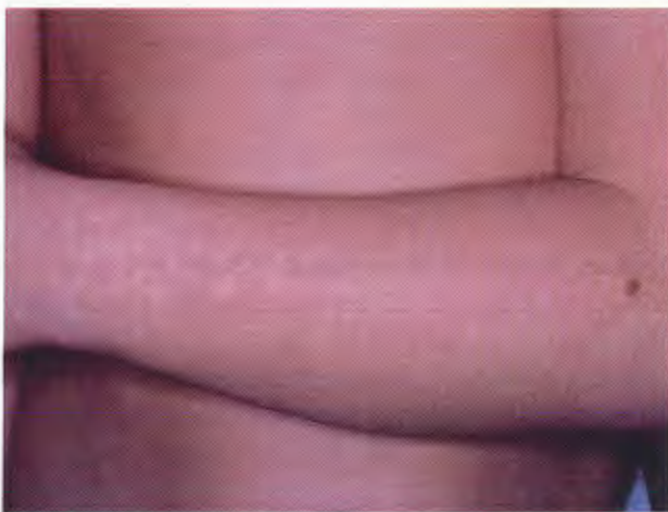
Figura 1. Infección por parvovirus B19. Exantema eritematoso en brazos.

La curva epidémica mostró una distribución asimétrica con desviación a la izquierda, con un acmé el día 09 de mayo cuando se identificaron el caso primario y un caso co-primario del brote, seguidos de cinco casos secundarios. El mecanismo de transmisión de la