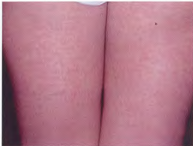
Figura 2. Infección por parvovirus B19. Exantema eritematoso en muslos.