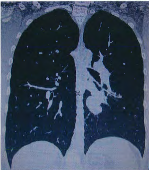
Figura 1. TAC con múltiples metástasis bilaterales.

ciclos de tratamiento adyuvante con bleomicina (VP16) y ciclofosfamida (CFM); estuvo vigilado durante un año. El seguimiento se llevó a cabo con TAC pulmonar cada tres meses; no se detectaron metástasis pulmonares durante 11 meses. En una TAC de control con técnica de "lung care" se apreciaron varias lesiones bilaterales. La de mayor volumen localizada en el pulmón izquierdo, medía 4 x 5 cm de diámetro en los segmentos 9 y 10, en contacto con el bronquio secundario (Figura 1). Las pruebas de función respiratoria, biometría hemática y tiempo de coagulación fueron normales. Se realizó toracotomía posterolateral izquierda con preservación muscular. Se resecaron en cuña dos lesiones pequeñas (Figura 2); una lesión de mayor tamaño requirió resección extraanatómica (resección que no sigue las delimitaciones anatómicas de los lóbulos pulmonares) del segmento superior del lóbulo inferior, con márgenes libres de enfermedad macroscópicamente, es decir, a simple vista. Durante la disección se identificó un trombo tumoral dentro de la vena pulmonar inferior izquierda. Se realizó pericardiotomía para control vascular. Una venotomía permitió identificar el trombo tumoral que estaba firmemente adosado al endotelio vascular. Se realizó una auriculotomía para extraer el trombo y reparación vascular. En el transoperatorio se produjo un