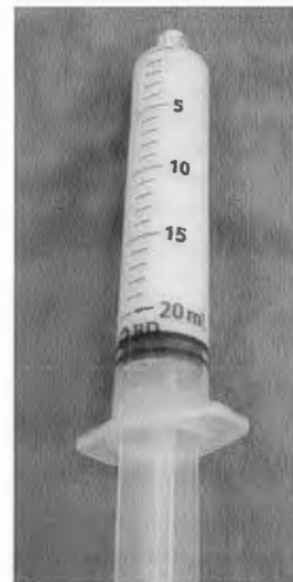
Figura 1. El aspecto lechoso del derrame hace el diagnóstico de quilotórax

Niño producto de madre de 32 años GI, obtenido por cesárea; calificado con Apgar de 8-9, eutrófico. A los 22 días de edad empezó a tener dificultad respiratoria, cianosis peribucal, tos productiva y rinorrea. Una radiografía de tórax mostró una imagen compatible con una masa, probablemente vascular y derrame. El paciente fue enviado a nuestra unidad con un sello de agua. Exploración física. Regulares condiciones generales, dificultad respiratoria, hipoventilación pulmonar derecha, sin estertores. El sello de agua estaba en el sexto espacio intercostal a nivel de la línea axilar anterior y no funcionaba. Abdomen normal. Biometría hemática: Hto, 37.7%; Hb, 11; leucocitos, 3250; neutrófilos, 50%; linfocitos, 42%; metamielocitos, 2%; eosinófilos, 2%; bandas, 4%; plaquetas, 280,000. Citoquímico de líquido pleural: DHL 688 UI/L, hifas y levaduras negativas; aspecto quiloso, blanquecino; glucosa 34 mg/dL, (Figura 1) sedimento escaso, coagulabilidad nula, pH 8, Hb positivo, proteínas totales 2661 mg/dL, colesterol 7 mg/dL, eritrocitos 106 mm 3 , leucocitos 28 mm 3 . Fosfatasa alcalina 153 UI/L, alanin-amino-transferasas 64 UI/L, deshidrogenasa láctica 3553 UI/L, proteína C reactiva 31.3 mg/L, albúmina 4.2 g/dL, colesterol 68.0 mg/dL. Proteínas totales 6.2 g/dL, Relación albúmina-globulina 2:1, bilirrubinas totales 0.5 mg/dL. Radiografía de tórax (Figura 2): Derrame pleural derecho. La tomografía de tórax mostró el derrame pleural en el pulmón derecho;