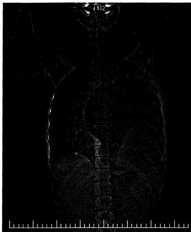
Figura 1. Topograma: vólvulo gástrico organo-axial.