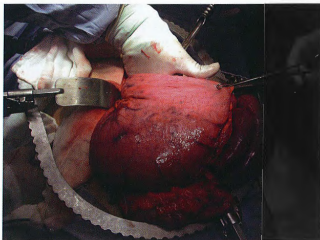
Figura 3. Persistencia gastromegalia posterior a la punción evacuadora para reducir la hernia diafragmática.